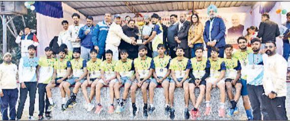
भिवानी। अतिथियों के साथ विजेता विद्यार्थी।