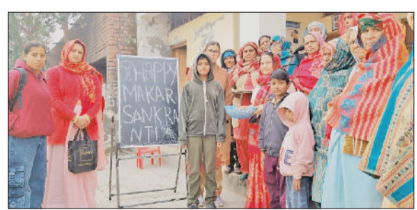
बवानीखेड़ा। बवानी खेड़ा खंड के सभी आंगनवाड़ी केन्द्रों में बेटियों के साथ मकर संक्रांति का त्योहार बड़ी धूमधाम से मनाते हुए।