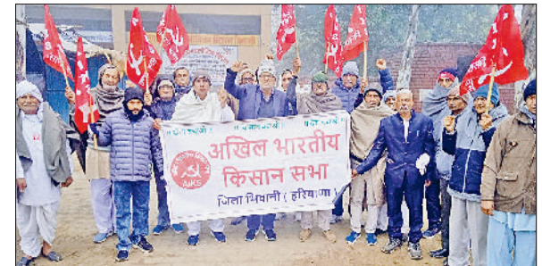
भिवानी। जींद कन्वेंशन के लिए रवाना होते किसान, मजदूर व कर्मचारी।

लिप रोकी गई अनुमति को तत्काल बहाल किए जाने, कार्यक्रम रद्द होने के कारण संगठन और कार्यकर्ताओं को हुए भारी वित्तीय नुकसान की भरपाई करने, ओबीसी की जाति आधारित जगणना के मुद्दे को दबाने की कथित साजिश को जांच