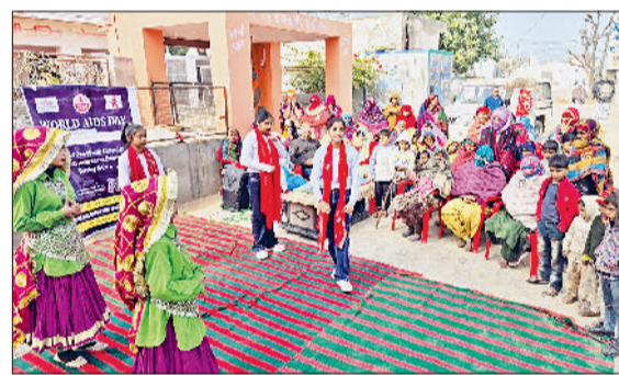
भिवानी। नाटक का मंचन कर ग्रामीणों को एड्स के प्रति जागरूक करते कलाकार।

हरियाणा स्टेट एड्स कंट्रोल सोसायटी स्वास्थ्य विभाग हरियाणा पंचकूला के निर्देशानुसार भिवानी सामान्य अस्पताल सीएमओ, डिप्टी सीएमओ की कुशल मार्गदर्शन के अंतर्गत गांव मोरका में हेमंत सेनी कल्चरल थिएटर एंड वेलफेयर सोसाइटी के कलाकारों ने एड्स के प्रति ग्रामीणों को जागरूक किया। एड्स के फैलने, उसके लक्षण और