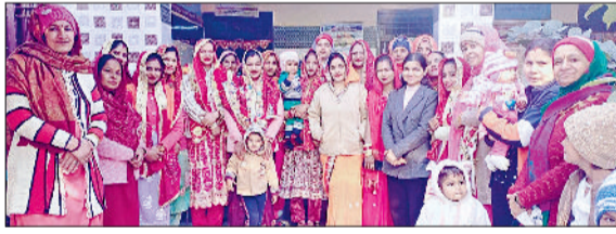
भिवानी। हमारा पोषण हमारी पंचायत कार्यक्रम में उपस्थित आंगनवाड़ी वर्कर व महिलाएं।

महिला एवं बाल विकास विभाग द्वारा ग्रामीण क्षेत्रों में स्वास्थ्य और पोषण के स्तर को सुधारने के उद्देश्य से हमारा पोषण हमारी पंचायत कार्यक्रम का सफलतापूर्वक आयोजन किया। यह विशेष अभियान बामला व रेवाड़ी गांवों में चलाया, जिसमें विभाग के अधिकारियों और स्थानीय आंगनवाड़ी कार्यकर्ताओं ने सक्रिय