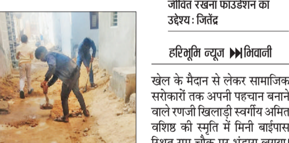
भिवानी। गली की सफाई करते हुए।