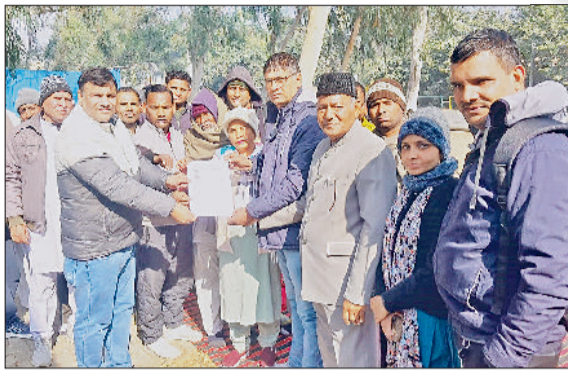
भिवानी। लघु सचिवालय परिसर के बाहर प्रदर्शन करते बामसेफ और भारत मुक्ति मोर्चा के सदस्य।

कहा कि बामसेफ के 42वें और भारत मुक्ति मोर्चा के 15वें राष्ट्रीय अधिवेशन के लिए सभी कानूनी औपचारिकताएं दो महीने पहले ही पूरी कर ली गई थीं। उन्होंने कहा कि अंतिम समय पर आरएसएस और भाजपा के दबाव में अनुमति रद्द करना न केवल हमारे मौलिक अधिकारों का हनन है, बल्कि यह ओबीसी, एससी, एसटी और मूलनिवासी समाज की एकजुटता को तोड़ने की कोशिश है। ज्ञापन के माध्यम से संगठन ने केंद्र और राज्य सरकार के समक्ष अधिवेशन के