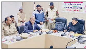
चरखीदादरी। समाधान शिविर में समस्या सुनते उपायुक्त।

डॉ. मुनीश नागपाल ने लघु सचिवालय हाल में जिला प्रशासन द्वारा आयोजित समाधान शिविर में नागरिकों की समस्याएं सुन रहे थे। उन्होंने नागरिकों की समस्याएं सुनने के दौरान मौके पर उपस्थित संबंधित विभागों के अधिकारियों को स्पष्ट निर्देश