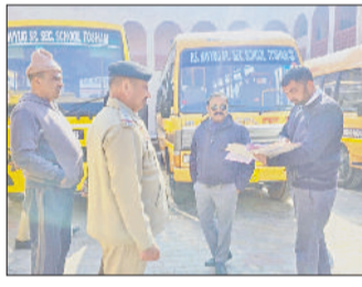
तोशाम। निजी स्कूलों के बसों के कागजातों की जांच करती टीम।

एसडीएम ने बसों में आपातकालीन गेट, जीपीएस ट्रैकर, सीट बेल्ट, इंगोर्श व सुरक्षा के मदेनजर सीसीटीवी कैमरे, आग